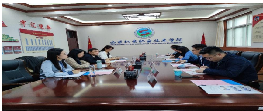
校企领导洽谈产业学院建设

同时利用学习通实践教学管理平台结合移动互联网与手机 APP，及时发布通知公告、即时通讯、签到定位、日志管理、在线测评、考勤管理、实习考评，随时了解学生现代学徒的学习状况，确保了实习效果。学院还与企业达成共识，定期通过视频会议了解实习学生的工作生活状态，方便对学生进行思想引导。