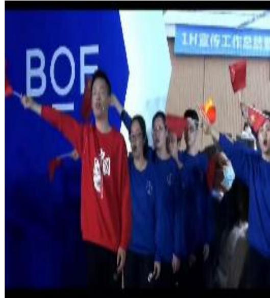
学生参加新春活动照片