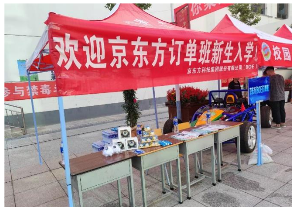
京东方订单班开学概况