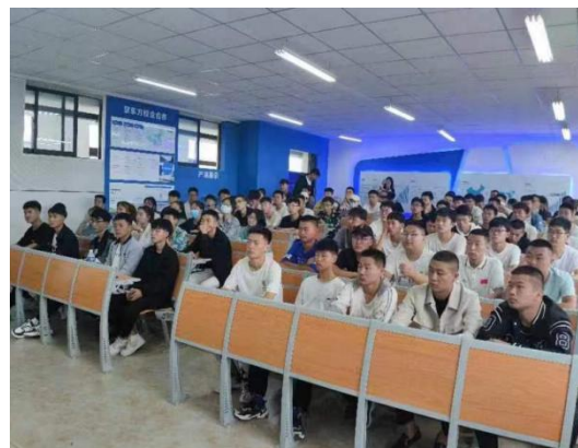
校友演讲助推校企合作深入发展