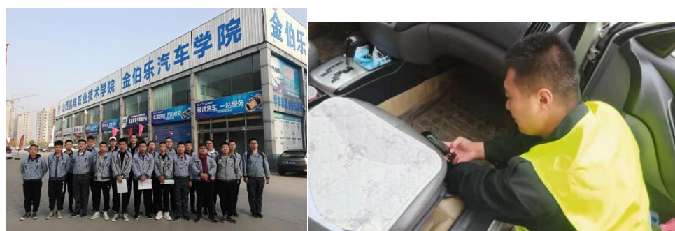
图7 学生实习与工作现场

2021年9月至2022年9月，先后承担了山西机电职业技术学院汽车工程系八个班级的生产实习任务总计120余人（图7），企业推荐6名技师作为学生的实习指导老师（图8），学校和企业联合制定实习方案和实习任务书，保质保量得完成了学校的教学任务，同时有19名2020届毕业生在金伯乐汽贸汽配城就业，金伯乐汽车学院运营效果明显。