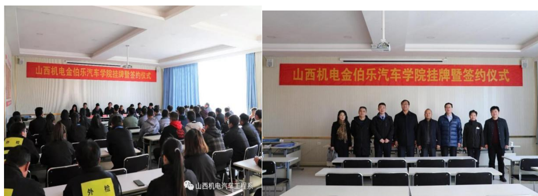
图6 山西机电金伯乐汽车学院挂牌暨签约仪式

2018年12月28日，山西机电职业技术学院与长治市汽车销售与维修行业协会、长治市金伯乐汽贸汽配城有限公司实行行校企合作，共建“山西机电金伯乐汽车学院”揭牌仪式在长治市金伯乐汽贸汽配城隆重举行，山西机电金伯乐汽车学院正式成立（图6）。