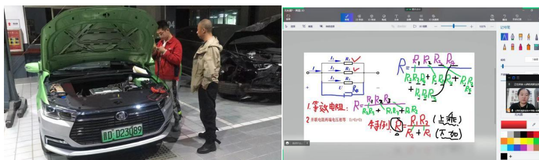
图 4 金伯乐班授课实况

结合教师和企业师傅们的实际情况，以及疫情防控政策，授课采用学习通+线上授课，充分利用学校的线上教学资源——学习通等，结合教师的直播课程，完成教授课程内容（图 4）。企业师傅们也克服了工作忙，任务重等诸多困难，认真学，认真记，配合教师完成教学计划，取得了良好效果。